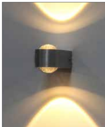
Maßskizze Beam 2